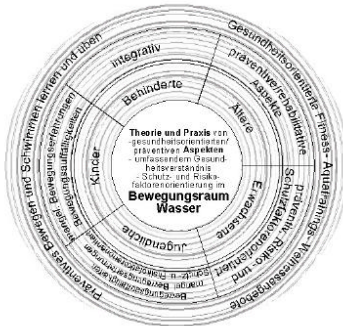
Abb. 3: Kompass II. Mindestanforderungen für adressatenbezogene gesundheitsorientierte, präventive Angebote im Bewegungsraum Wasser

Um die erforderlichen Mindestanforderungen für das zu zertifizierende Angebot zu erarbeiten, ist der Kompass von innen nach außen zu lesen. Es ist dabei zu beachten, dass diese inhaltlichen Schwerpunkte immer umfassend verstanden werden müssen. D.h. es werden sowohl physische, als auch psycho-soziale Ressourcen berücksichtigt (im Innenkreis dargestellt). Jedes Angebot berücksichtigt somit sowohl die Verminderung von Risikofaktoren, als auch die Bewältigung von Beschwerden und Missbefinden. Zur weiteren Strukturierung und Einordnung der zu bestimmenden Angebote ist der Adressatenbezug zu berücksichtigen (vgl. Abb. 3).