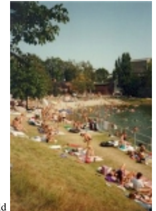
Das vereinseigene Sommerbad Neptun am Mühlenfeld