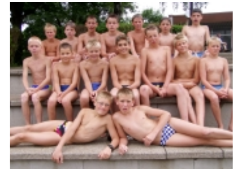
Der Südwestfalenmeister Jugend D 2003