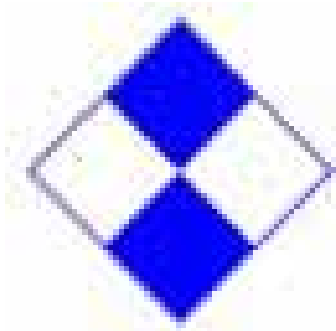
SV Blau-Weiß Bochum

Schon damals wurde das aktive Schwimmen im Verein groß geschrieben.