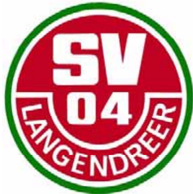
Sportverein Langendreer 04